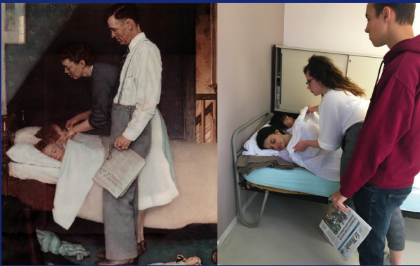
▲ Norman Rockwell (1894-1978), "Freedom From Fear," 1943. Oil on canvas, illustration for "The Saturday Evening Post," March 13, 1943. Norman Rockwell Museum Collections.