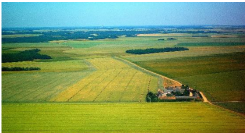
N° ..... Culture céréalière en Beauce, près de Paris.

À placer à l'intérieur de la copie. Ne pas inscrire de signe distinctif sur l'annexe (nom, signature...).