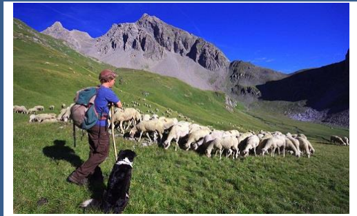
N° ..... Élevage de brebis dans les Alpes