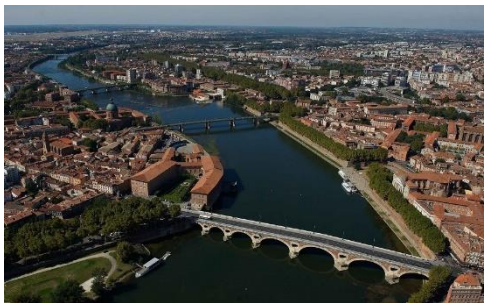
N° ..... La Garonne traversant Toulouse.