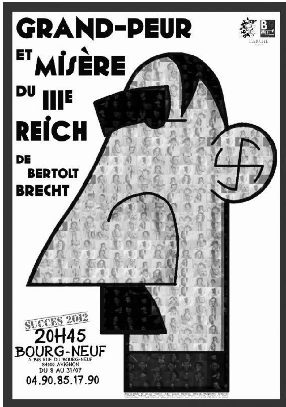
Affiche de la compagnie de théâtre Branle-Bas d'Arts Conception affiche : Edouard Tavinor et Malena Perrot