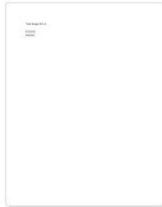
test stage st lô