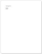
test stage st lô